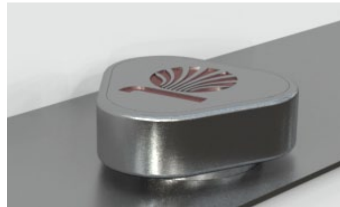
Detail: Dreh-/Drückknopf (Rendering)